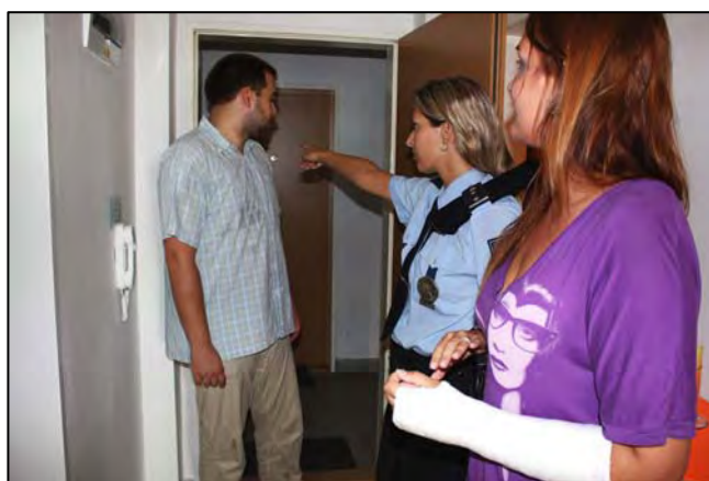
Obr.: Vykázání nebezpečné osoby z bytu

Lze-li na základě zjištěných skutečností, zejména s ohledem na předcházející útoky, důvodně předpokládat, že dojde k nebezpečnému útoku proti životu, zdraví, svobodě nebo zvláště závažnému útoku proti lidské důstojnosti, je policista oprávněn toho, kdo je podezřelý z takového jednání, vykázat z bytu nebo domu společně obývaného s ohroženou osobou, jakož i z jeho bezprostředního okolí.