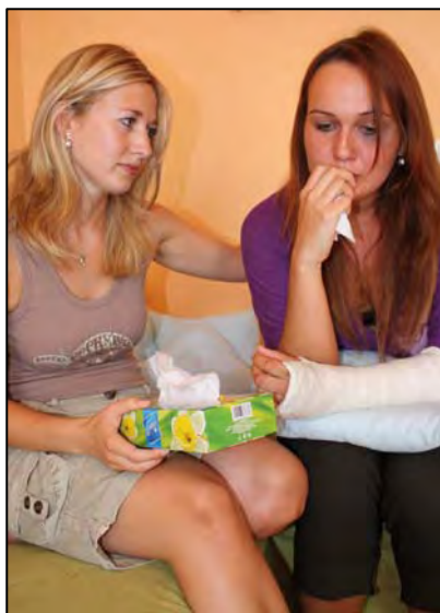
Obr.: Svěřte se přátelům