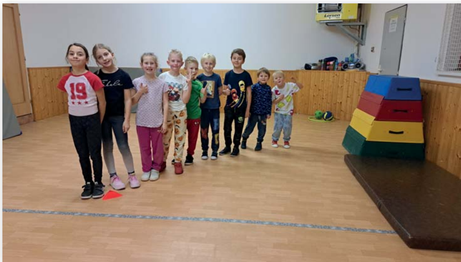
Tělocvična – „velké švihadlo“ (děti do 8 let)