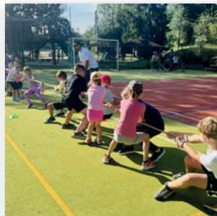
Silově i psychicky náročná disciplína – přetahování lanem