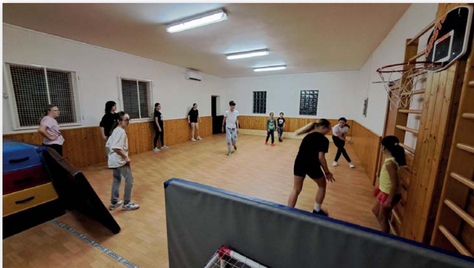
Tělocvična – „vybíjená“ (děti nad 9 let)