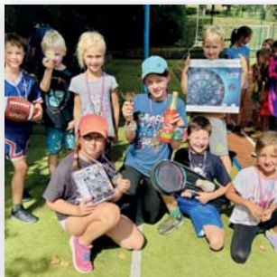
Předávání cen (poháry, medaile, šampaňské – jahoda, ceny)