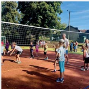
Turnaj v „přehazované“

Dne 5. 9. 2025 jsme ve spolupráci ze ZŠ Tučapy uspořádali sportovní dětský den. Turnaj v přehazované doplnily další disciplíny, hod na koš, skok snožmo, hod medicinbalem, slalom na koloběžce, střelba na branku (florbal), hod na cíl a přetahování lanem. Všechny děti projevily velkou snahu dosáhnout co nejlepší výsledky a byly odměněny za své sportovní výkony cenami.