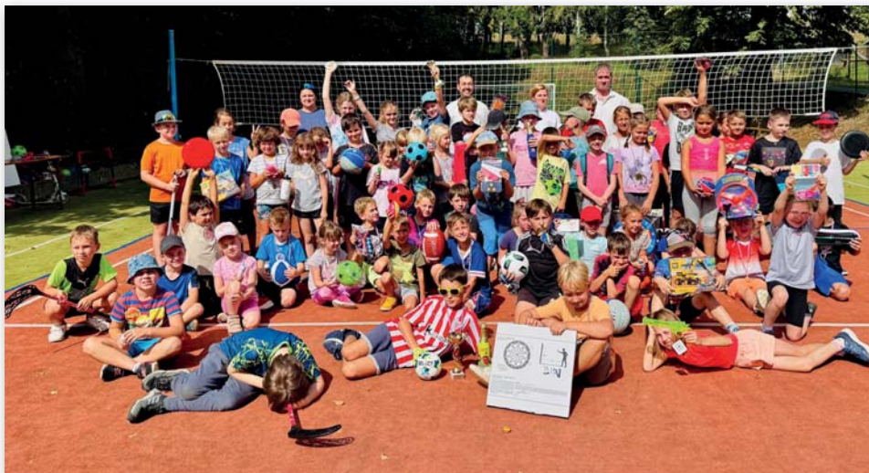
Závěrečné skupinové foto – „Sportovní dopoledne 2025“