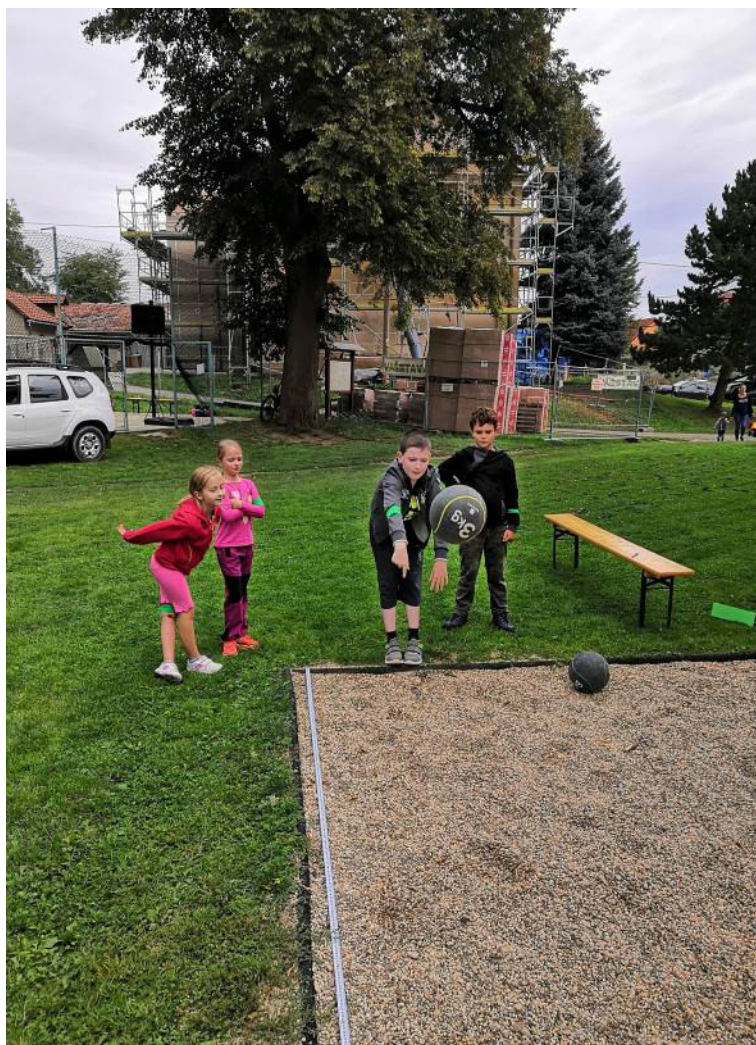
Hod medicinbalem – sportovní den ZŠ